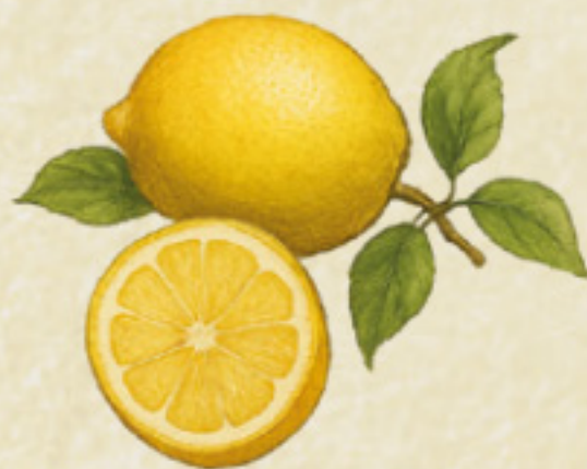
Citrus x limon