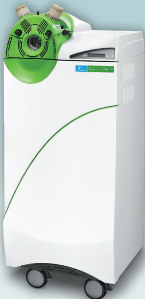
Espectrómetro de masas triple cuadrupolo Qsight 220 PerkinElmer

productos, así que imagínate de la precisión y sensibilidad que estamos hablando. En términos técnicos, este equipo es capaz de detectar partes por trillón (ppt), con lo que sus resultados son tremendamente confiables". Moncada agrega que la técnica de espectrometría de masas combina la capacidad de ir desde lo general a lo específico, lo que en la práctica permite detectar desde muchos a un componente en una muestra, con la posibilidad de establecer límites de detección impensables hace algunos años atrás.