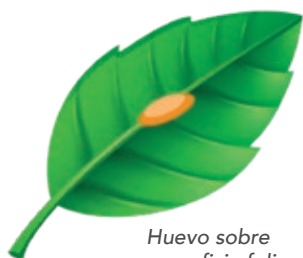
Huevo sobre superficie foliar

Metoxifeno 240 SC zid es un insecticida que actúa principalmente por ingestión sobre larvas de lepidópteros. También controla huevos cuando es aplicado antes o después de la ovipostura.